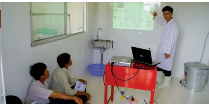
Formation du personnel de l'abattoir au respect des bonnes pratiques. Le formateur insiste sur l'hygiène et le principe de la marche en avant.