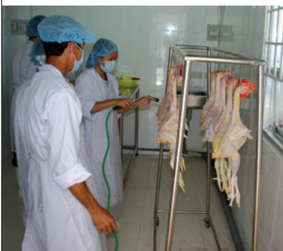
Finitions de la plumaison.

L'investissement d'Asvelis, chargé de mener à bien ce projet au Vietnam, va de l'approvisionnement en poussins pour certaines filières jusqu'à la construction d'abattoirs,