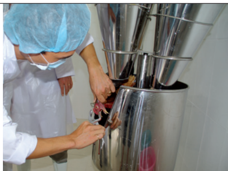
Saignée d'un poulet par un employé, sous la direction des vétérinaires d'Asvelis.