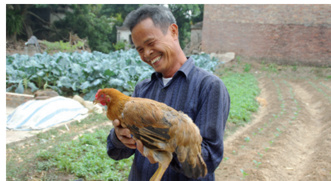
Dans le cadre du projet Stop AI , les poulets choisis sont à croissance lente.