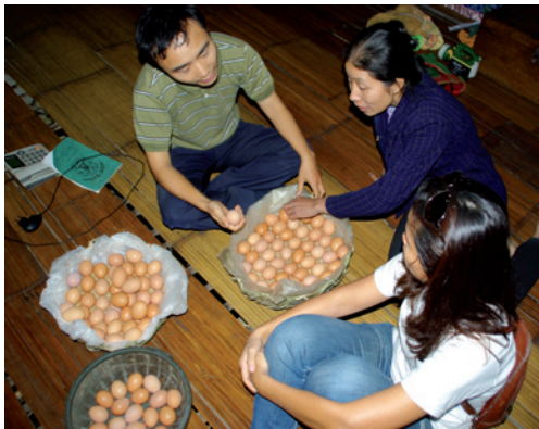
Récolte des œufs d'une des fermes du projet.

Dans ce cadre, depuis 2009, Asvelis accueille en même temps des étudiants des deux établissements. Cette structure dynamique, impliquée dans différents projets (elle installera cette année un centre vétérinaire pour les animaux de ferme près de Hanoï), l'est également dans différents pays. Ainsi, elle s'implantera cette année en Afrique.