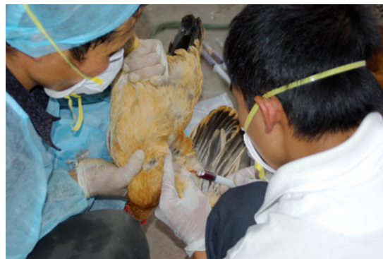
Prise de sang chez un poulet dans le cadre du projet de recherche avec le Cirad.