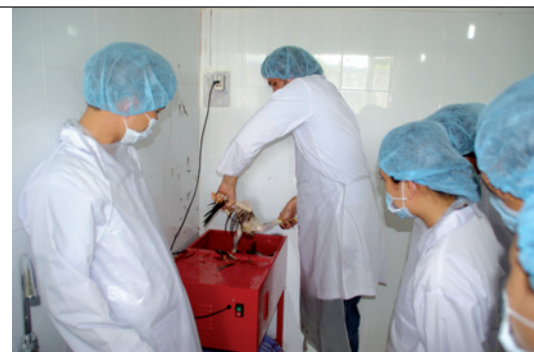
Démonstration de la plumaison par les vétérinaires d'Asvelis.