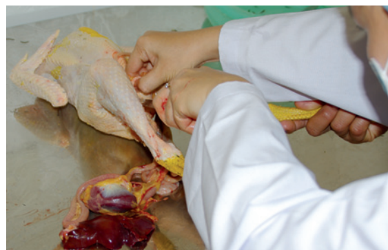
Démonstration de l'éviscération des carcasses.